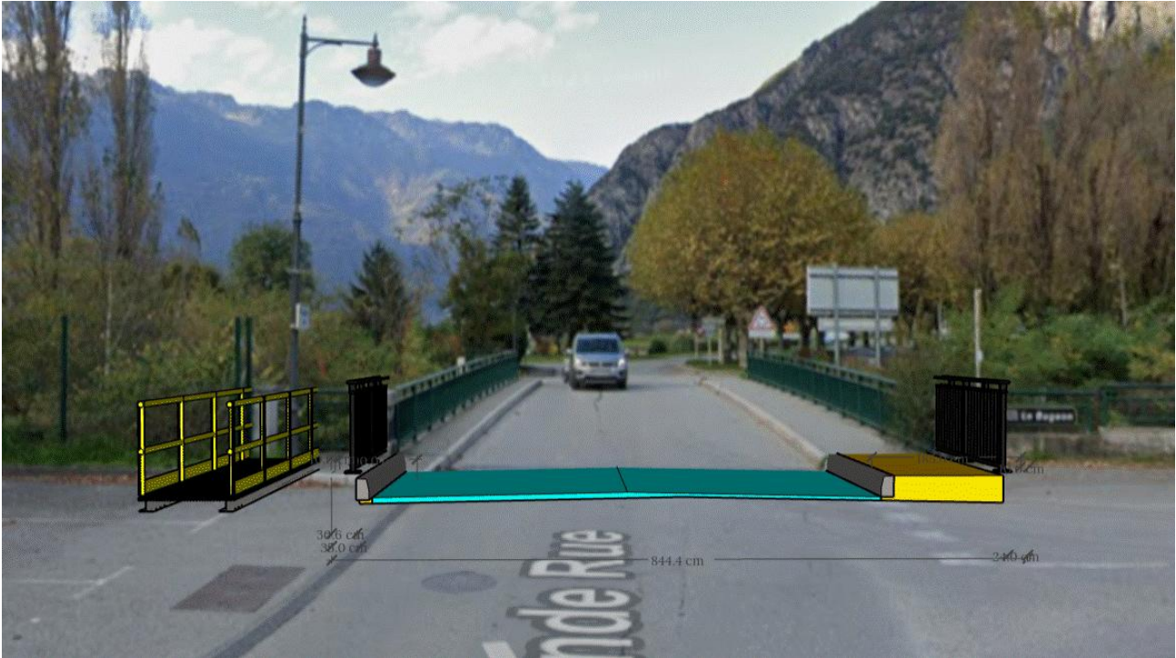
Passerelle piétonne provisoire (croquis de principe)